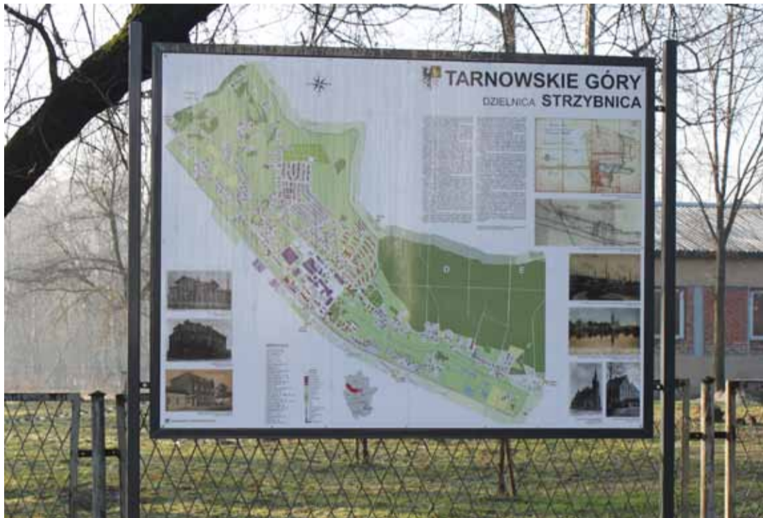
Tak wygląda dziś tablica z planem Strzybnicy.

usługowych czy mieszkalnych. Wymagało to kilku miesięcy mrówczej pracy, ale mieszkańcy pozytywnie oceniają jej efekty. Plany są naprawdę dokładne.